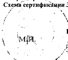
Схема сертификации З.

ДОПОЛНИТЕЛЬНАЯ ИНФОРМАЦИЯ Место нанесения знака соответствия: на изделии и в товаросопроводительной документации.