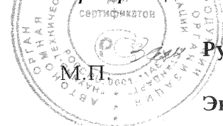
Схема сертификации № 3

ДОПОЛНИТЕЛЬНАЯ ИНФОРМАЦИЯ Маркировка продукции знаком соответствия производится по ГОСТ Р 50460-92. Место нанесения знака соответствия - на изделии, упаковке и в сопроводительной документации.