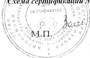
Схема сертификации № 3

ДОПОЛНИТЕЛЬНАЯ ИНФОРМАЦИЯ Маркировка продукции знаком соответствия производится по ГОСТ Р 50460-92. Место нанесения знака соответствия - на изделии, упаковке и в сопроводительной документации.