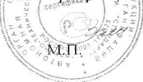
Схема сертификации № 3

ДОПОЛНИТЕЛЬНАЯ ИНФОРМАЦИЯ Маркировка продукции знаком соответствия производится по ГОСТ Р 50460-92, Место нанесения знака соответствия - на изделии, упаковке и в сопроводительной документации.