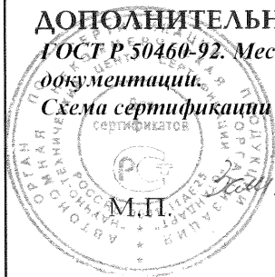
Схема сертификации № 3

ДОПОЛНИТЕЛЬНАЯ ИНФОРМАЦИЯ Маркировка продукции знаком соответствия производится по ГОСТ Р 50460-92. Место нанесения знака соответствия - на изделии, упаковке и в сопроводительной документации.